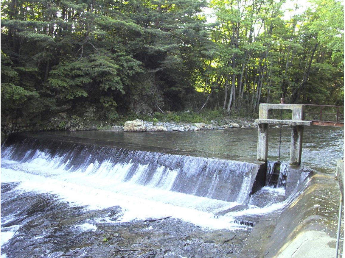
水源：石籠川 日影沢堰