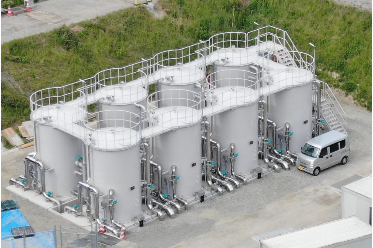
立石山浄水場2系ろ過機(令和5年12月完成)