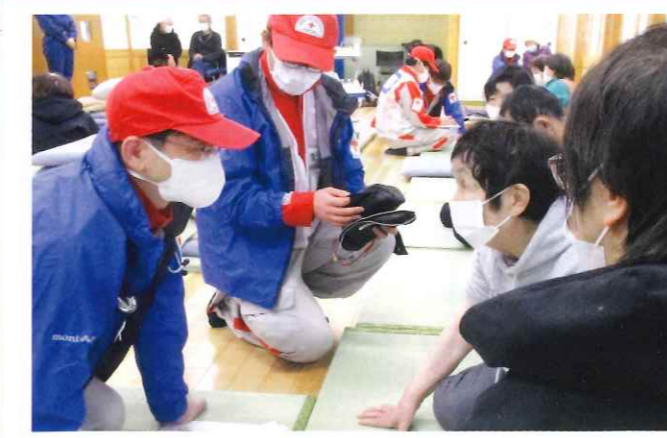
石川県能登町の避難所で巡回診療する福島県支部救護班

令和6年1月1日に発生した能登地方を震源とする地震は、石川県を中心に甚大な被害をもたらしました。 日本赤十字社では医療救護班の派遣をはじめ、避難されている方々への救援物資の提供、義援金の募集など、被災者支援に全社を挙げて取り組んでおります。 特に救護班の派遣においては、1月2日から日赤災害医療コーディネーターチームや救護班(DMATを含む)を現地に派遣し、被災者の手当てや診察などの救護活動を開始。 福島県支部においても1月6日に第一班を派遣して以降、継続して救護班を派遣し、避難所等での巡回診療やこころのケア活動を行ってまいりました。