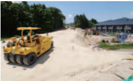
▲市道赤木・狐森線の工事現場