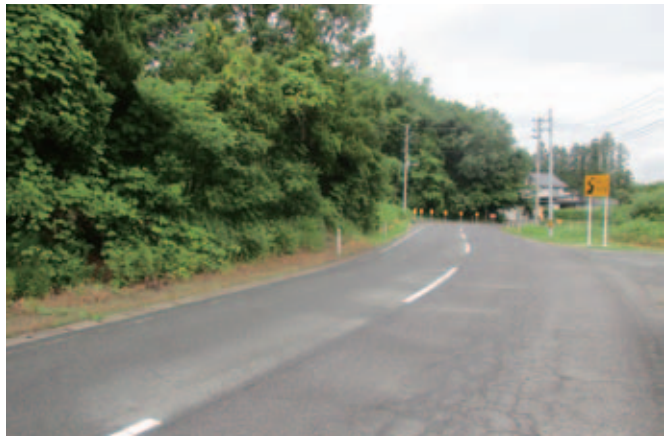
▲県道に歩道の整備を（県道本宮三春線）

問 県道整備の計画が進んでいる中で、市の対応は。路線ごとに具体的な進行状況を伺う。大橋五百川線の改良、本宮熱海線の整備促進、本宮三春線の整備について。各路線は狭路で歩道未設置のため、非常に危険な県道である。