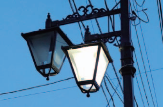
▲防犯灯建設事業費補助金（LED化）の積極的な活用を

問 町内会組織自体も高齢化や少子化、若い世代流出のあおりを受け弱体化している。LED化が進められている防犯灯および街路灯の新設や維持管理を市がやるべき。町内会管理のごみステーションに町内会以外の方が捨てる場合は拒否できるか。