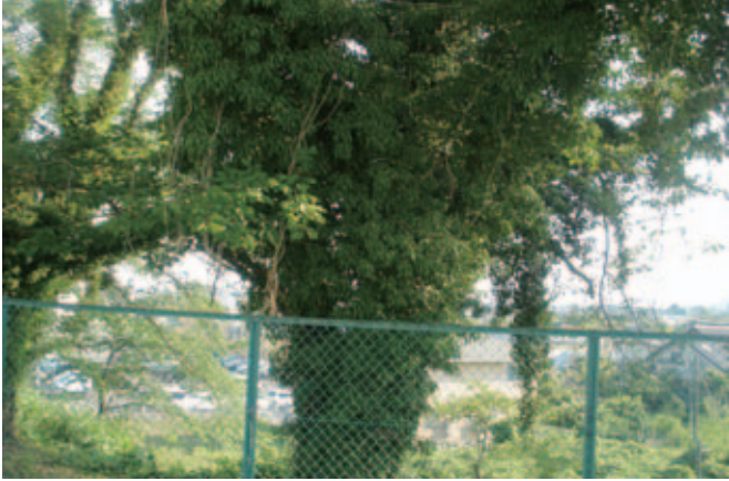
▲ツタが巻き付いている桜の木

問 補聴器の購入助成制度と県内の実施状況との認識について伺う。今年1月に昨年の倍の239自治体にとっていると報道があり、大玉村で今年から実施する認知症予防社会参加介護予防など、効果ある制度の導入