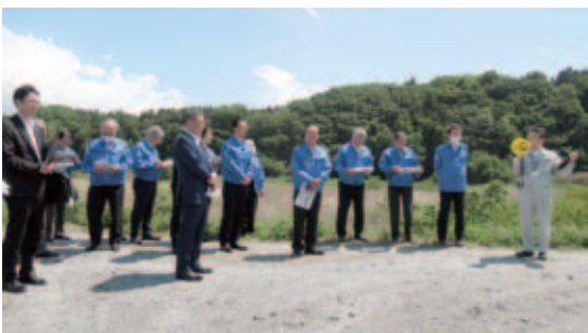
▲現地で説明を受ける議員(鏡石町)

5月21日、市議会全議員で遊水地整備事業の取組みについて理解を深めるため、予定地を視察しました。