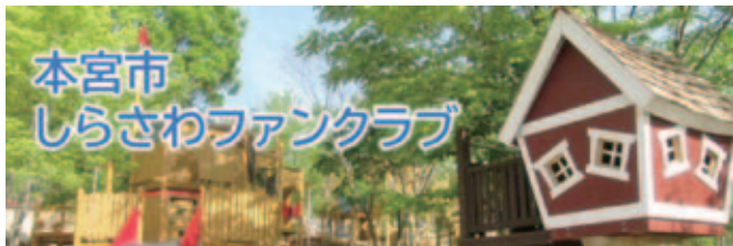
▲新規事業「しらすわファンクラブ」で白沢地区の魅力を発信していく