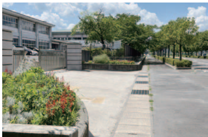
▲子ども達がメリットを最大限享受できるような教育行政を