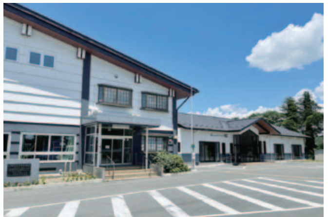
▲スマイルルームがあぶくま憩の家に移転されます