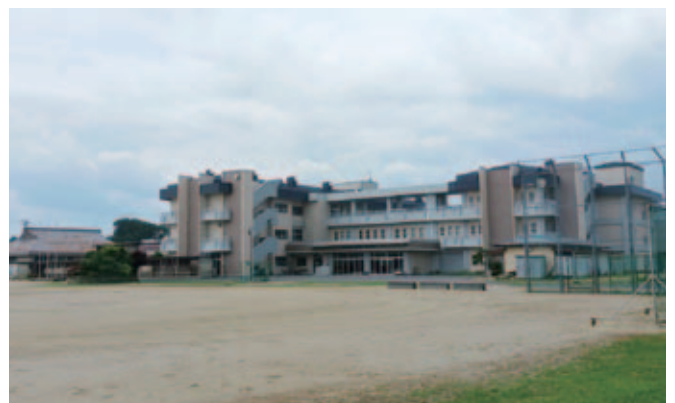
▲児童・生徒の学校生活を修繕箇所の迅速な情報共有・対応で