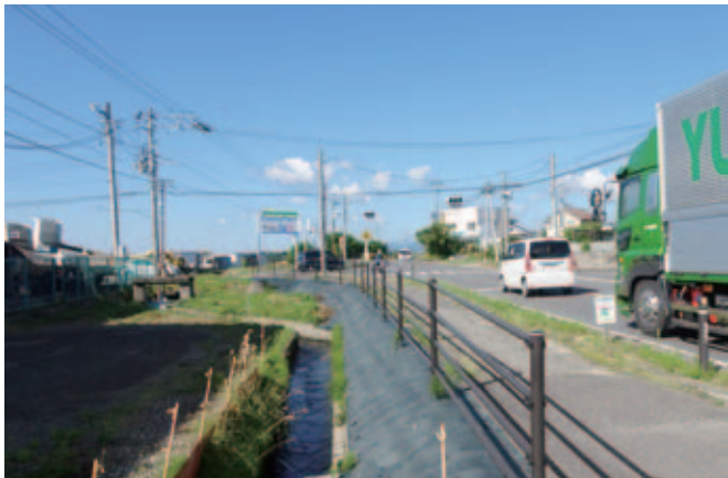
▲交差点改良工事はいつになるのか

問 昨年、用地確保の目的が、工事予定地に昨秋防草シートが張られた。地元では当分工事に入らないのではとの声が聞かれる。集落内の狭隘な通学路を迂回する車両も多く早急な整備が望まれるがいつになるのか。