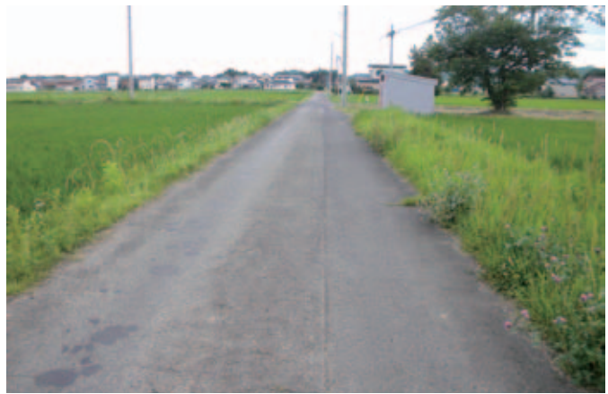
▲生活道路の側溝整備を

答 ①本人による体調チェック、異変を感じたら早めに休養、病院で受診する等早めの対応するよう指導している。②休職者は4名。職場復帰プログラムに基づき支援を行っている。