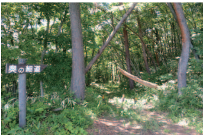
▲歴史的、文化的な道路施設の整備を