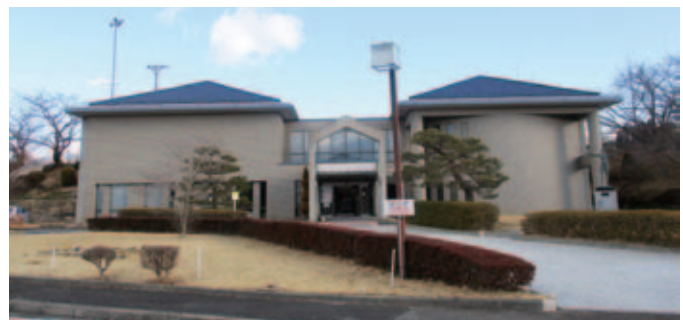
▲改修前の白沢ふれあい文化ホール

本宮市白沢ふれあい文化ホールの改修に伴い、新たな名称を募集し、「本宮市ふれあい美術館」と名称が選定されました。本条例において、旧名称の本宮市白沢ふれあい文化ホールは廃止となり、新たな名称でリニューアルオープン予定です。