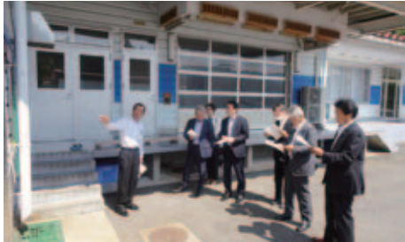
▲給食センターの現地調査の様子