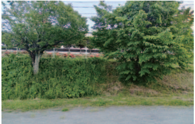
▲白沢中学校奉仕作業

問 学校奉仕作業について、少子化・人口減少により児童・生徒数も減っている中で、学校奉仕作業の現状は。また、今後人口減少の中どのように学校環境整備を実施して行くのか。