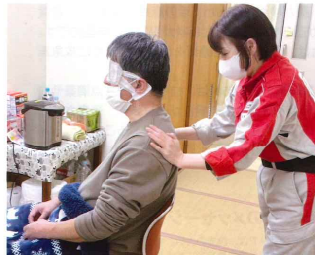
こころのケア班は、支援者支援として七尾市役所職員にリラクゼーションを実施

福島県支部からは、福島赤十字病院のメンバーを中心に1月6日から3月13日まで救護班5班41名、日赤災害医療コーディネートチーム2班6名、こころのケア班1班5名を、能登町・珠洲市・七尾市に派遣しました。また、DMAT(災害派遣医療チーム)の業務調整員や、厚生労働省からの要請による被災地医療機関支援のための看護師を輪島市に派遣するなど、避難所での巡回診療をはじめ、被災された方々に寄り添った活動を行いました。