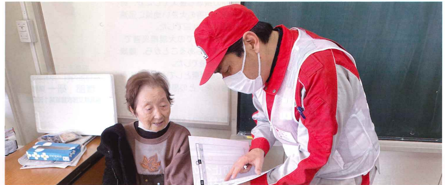
石川県能登町の避難所で診療を行う福島県支部救護班