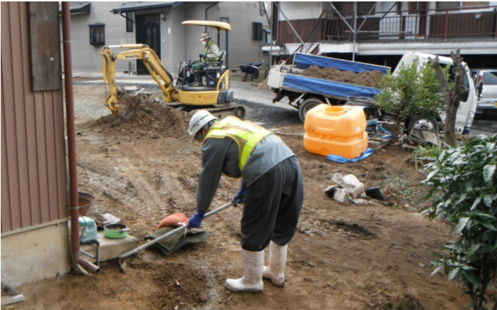
▲重機でできないところは、手作業で表土を除去します