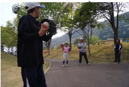
▲兄妹でキャッチボール

昨年から安心して自宅周りでキャッチボールなどができるようになり、長男は中学校で野球部に入り、小学生の長女はソフトボールスポ少で活動しています。