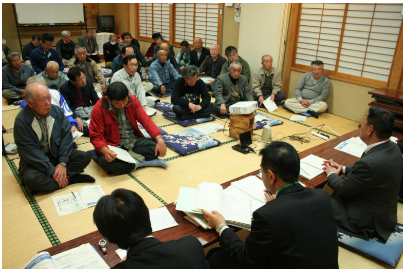
▲5月7日に、北町コミュニティセンターで開催した地域懇談会の様子 放射能対策から道路改良など幅広いご意見・ご要望をいただきました