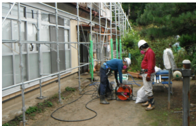
▲雨樋の拭き取りのため、住宅のまわりに足場を組みます

4月末時点での進捗状況は作業完了が11件で約5%、作業中のものを含めた進捗率は33件で約15%となっています。