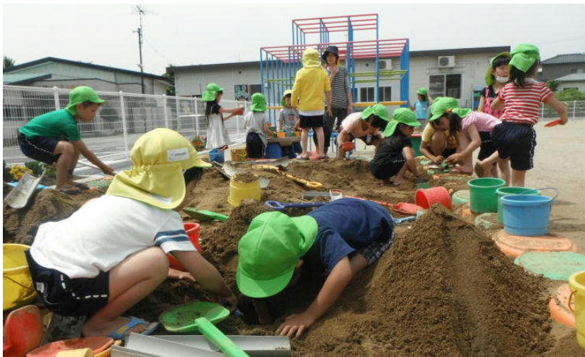
▲元気に外で遊ぶおひさま幼稚園の園児