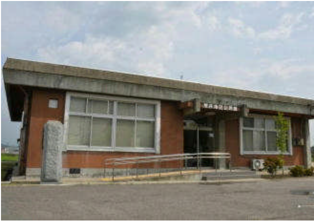
▲測定所が開設される荒井地区公民館

現在、農産物の放射性物質の測定は、本宮・白沢の2カ所で行っていますが、さらに測定環境の強化を図るため、新たに荒井地区公民館内に測定所を7月20日に開設します。農産物の測定には、従来と同様に事前予約が必要です。事前予約の受付開始は7月17日からとなります。