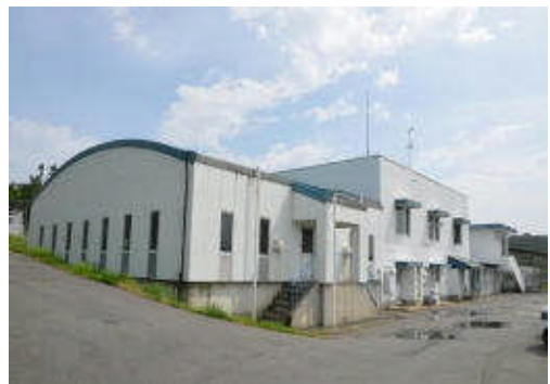
▲水道水の検査を行う立石山浄水場

市ではこの程、岩根にある立石山浄水場に放射性物質検査機器2台を配備し、7月から市内全ての浄水場(4カ所)の水道水の検査を週2回行っています。この検査は毎週月曜日と金曜日に行っていますが、県の検査が毎週水曜日に実施されていますので、水道水の検査は週3回行われています。 この検査結果についてはこれまでどおり市のホームページで公表しています。 なお、市の水道水から放射性物質は検出されていませんので、安心してご利用ください。