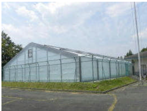
▲明るくきれいになったB&G海洋センター