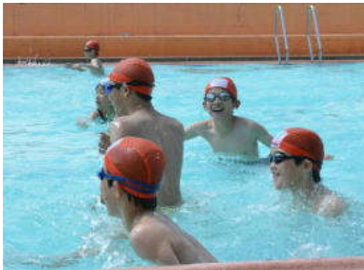
白岩小学校の屋外プールの様子

たことから、7月9日に白岩小学校が使用を開始しました。今後、ほかの小学校でも、プール清掃、設備点検などを進めて、条件が整い次第、随時使用を開始していく予定です。 なお、地震により改修が必要となった、糠沢小学校、本宮第一中学校、本宮第二中学校、白沢中学校については、今年度中に改修工事を行い、来年度からの使用を予定しています。