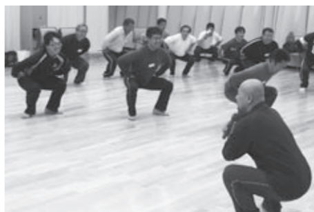
▲スロー筋トレの様子

本宮市民元氣いきいき応援プラザ（愛称：えぼか）を中心に市民の皆さんの健康増進を図ります。 また、集団検診、施設検診やがん検診事業の自己負担の軽減を図り、受診率の向上に努めます。 さらに保育所の待機児童をなくす受け入れ体制の確立、中学生までの医療費を無料化し子育て中の家庭の負担軽減を図ります。 （主な重点事業） ▽健康力アップ応援事業 ▽健康診査とがん検診事業