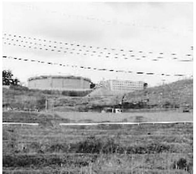
沈殿池工事が進む立石山浄水場

答 ①商業化や宅地化が進む ②商業化や宅地化が進む ③商業化や宅地化が進む ④商業化や宅地化が進む ⑤商業化や宅地化が進む ⑥商業化や宅地化が進む ⑦商業化や宅地化が進む ⑧商業化や宅地化が進む ⑨商業化や宅地化が進む ⑩商業化や宅地化が進む