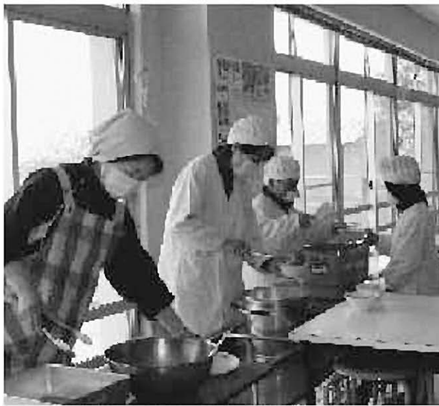
おいしい給食で、食材・栄養の学びの時間