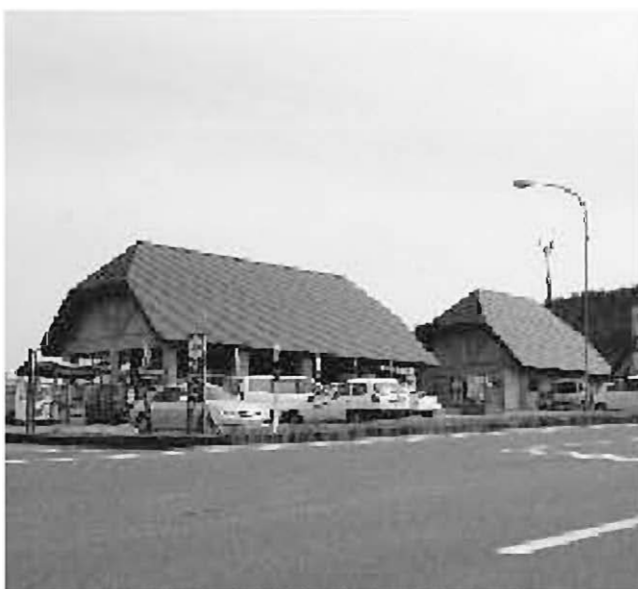
多くの利用がある道の駅(道の駅つちゆ)

①道の駅は国土交通省の認定が必要となり、場所・資金的にも難しい。物産館的なものは、今後必要かどうか時間をかけて検討したい。 ②市の責任で、駅前が空洞化しないよう対策を考える。