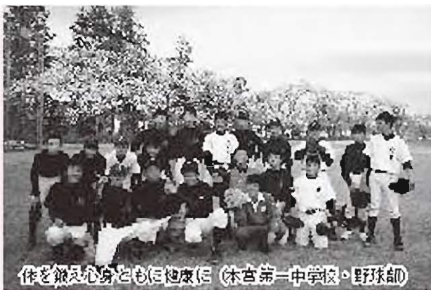
体を鍛え心身ともに健康に (本宮第一中學校・野球部)