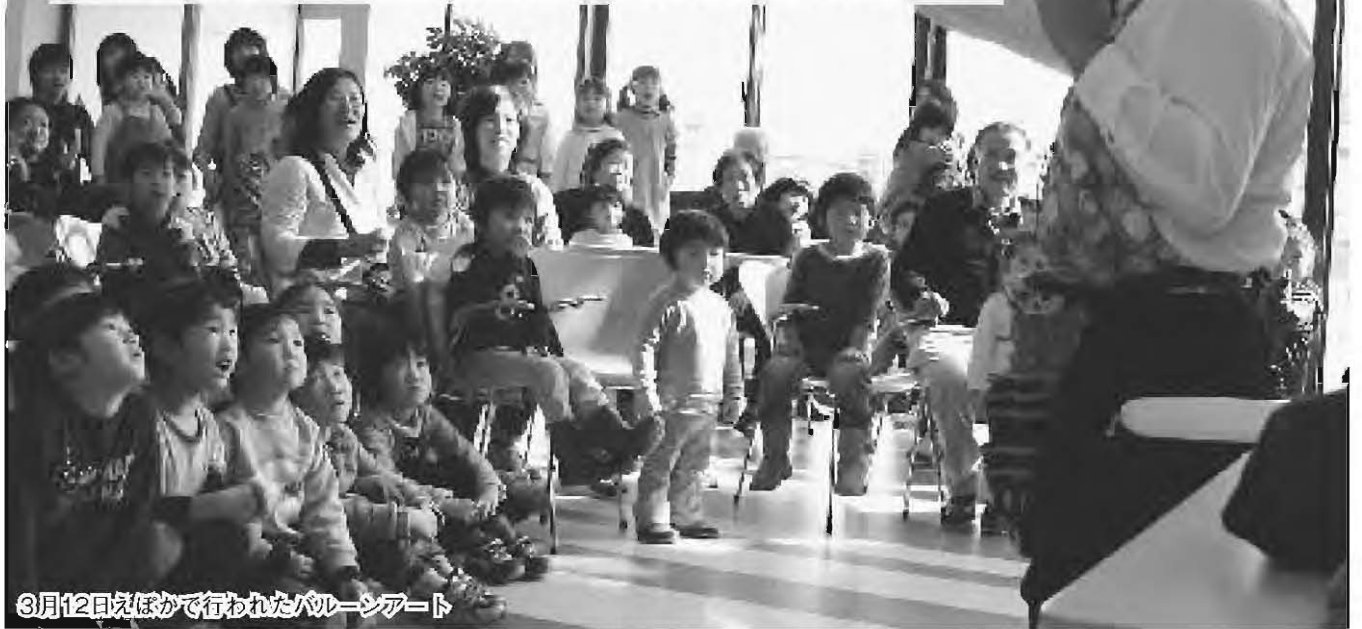
3月12日えほかで行われたパルーンアート

平成22年度各会計予算は、予算審査特別委員会を設置して、3月12日から17日までの4日間にわたり審査しました。新年度は、健康・子育て、農業振興、駅利用5,000人突破を目指し地域活性化を図る三本柱のほか、5つの重点事業に取り組む予算が計上されました。