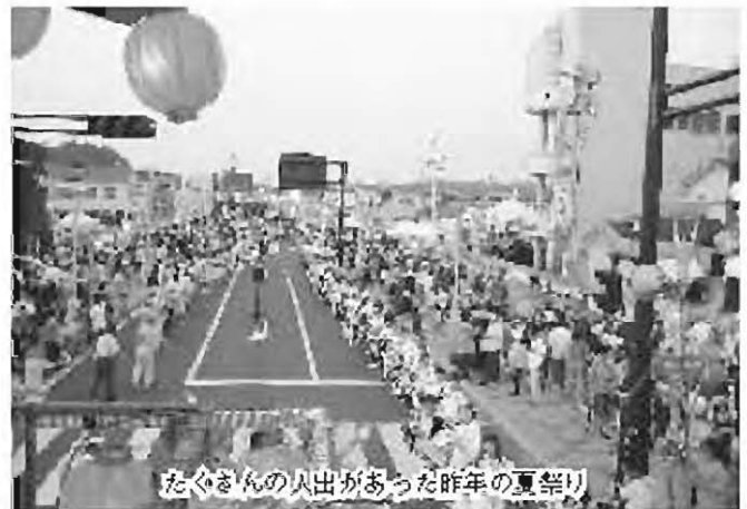
たくさんの人出があった昨年の夏祭り

答 健診は早朝から集まるので、バスを利用しでの実施には多方面の検討が必要である。えぼかのバスを利用して事業を考えたい。