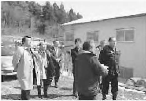
現地調査（白岩字埋内地区）

産業商工常任委員会には、付託議案がなかったため、所管事項調査を実施しました。 主な内容は、次のとおりです。