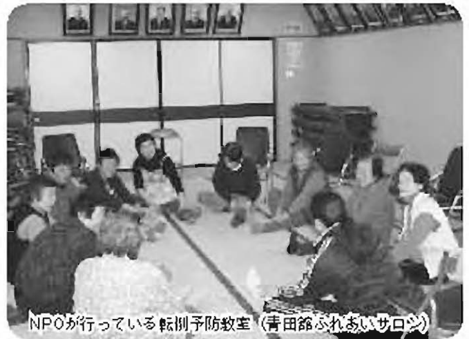
NPOが行っている転倒予防教室（青田館ふれあいサロン）