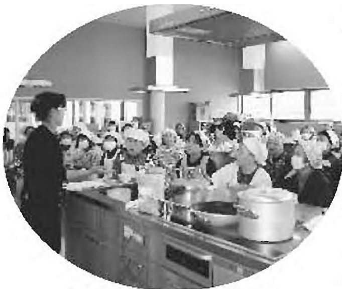
体の中から健康に!えぼかでの食の講座