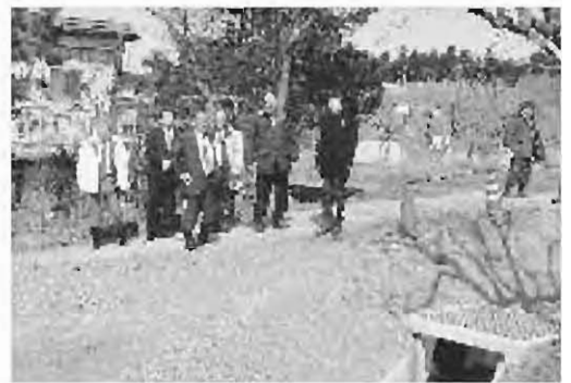
現地調査（高木地区：用水路整備）

900万円で、造成規模は4・3ヘクタールです。 委員会では、桑園の抜根や整地作業の現地を調査しました。