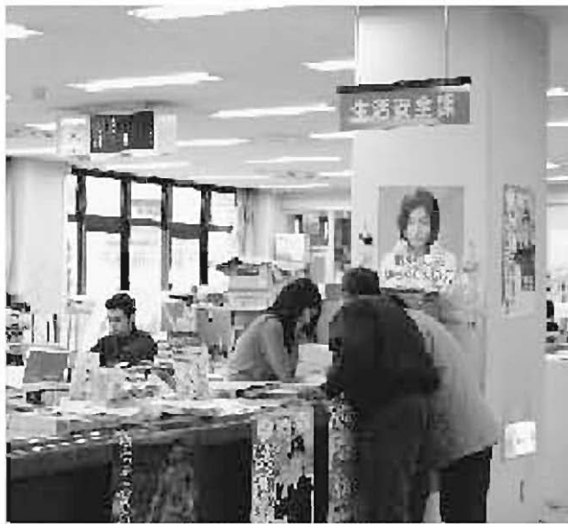
公平・公正な市民サービスを目指して

問 職員は市民全体の幸仕者であり、市民の一部に対してのみ幸仕者ではないことを自覚し、市民の一部に対してのみ有利な差別的取り扱いをしてはならない。