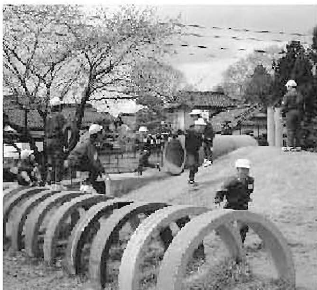
授業時間数の確保はどうか

答 月曜日の収納窓口を夜7時まで延長、分納相談などの対策で滞納を少なくする。さらに、少子高齢化の中で、人口減対策、地の利を生かした企業誘致を展開したい。 中学生まで医療費無料化、国保会計への繰出し等があり、財政健全化計画は1年前倒しで見直す。