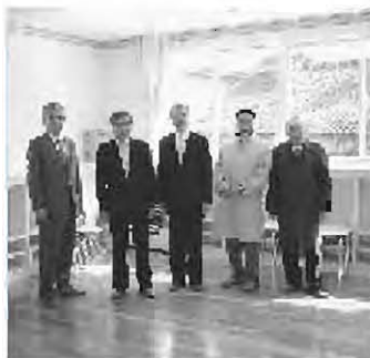
現地調査 (岩根幼稚園：園舎増築)