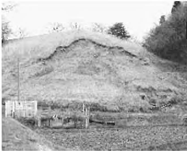
崩落している白沢中学校の圍法面

事業勘定で、医療費の伸びなどによる補正、直営診療施設勘定では、新型インフルエンザ対策の医療用機材調達などの補正を行いました。