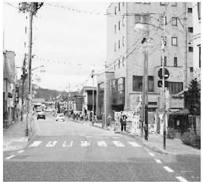
駅前広場工事期間中の清掃対策を！