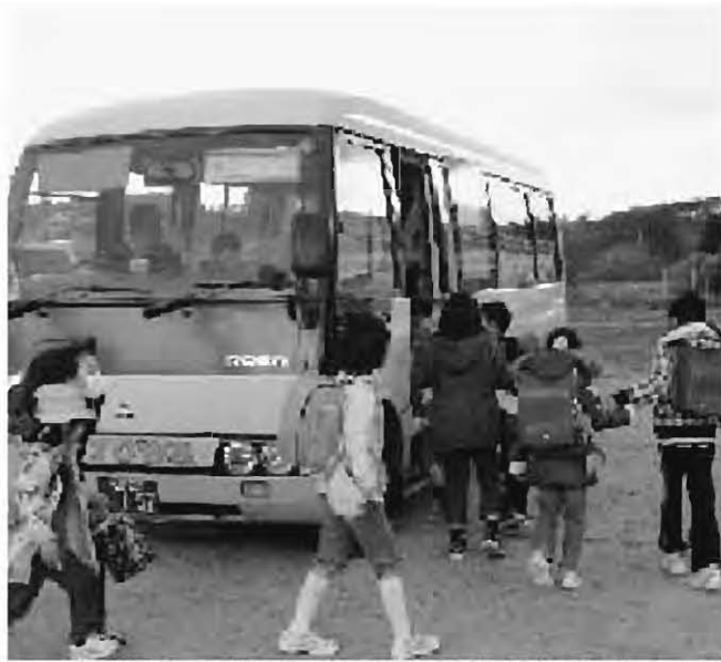
通学通園支援バスで自宅に帰る児童（糠沢小学校）