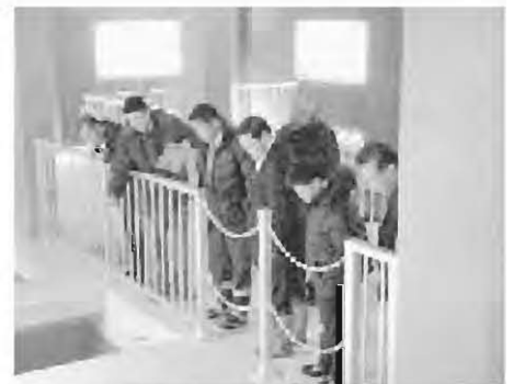
現地調査（平田石浄水場）

平成21年度の用地取得状況については、百目川〜昭代橋までのAゾーンと地域防災センター付近〜鳴瀬地区までのC〜2ゾーンの区間で、取得予定面積約5,200平方メートルの内、約1,500平方メートルの用地を取得し、約29%の進捗よく率であるとの報告がありました。