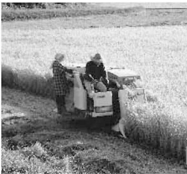
収穫は農家のいちばんの喜び

答 生産調整・保全管理の水田は、改善計画を市に提出し、認定を受ければ対象となる。 中山間等にある保全管理地などは、知恵を出しながら、集落営農的な考えのもとに、協力して復田への作業工程を取り組むことも考えられる。