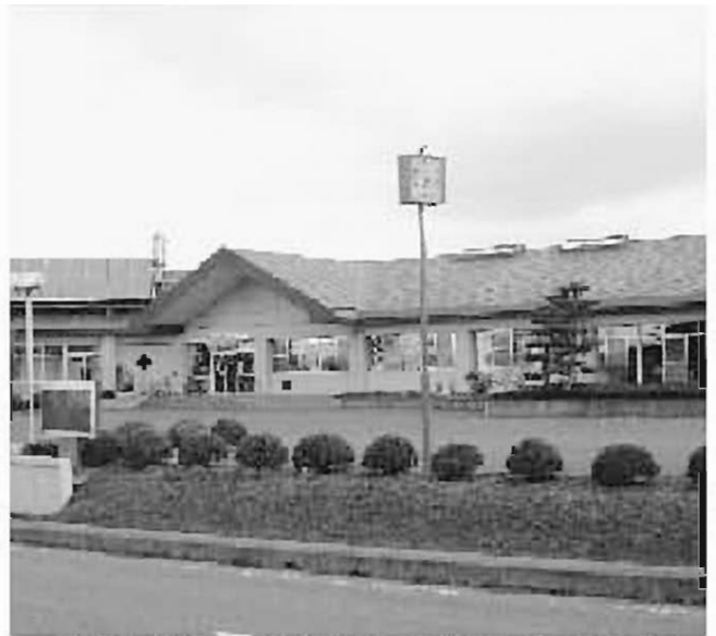
宿泊施設を併設して有効利用を（白沢老人福祉センター）