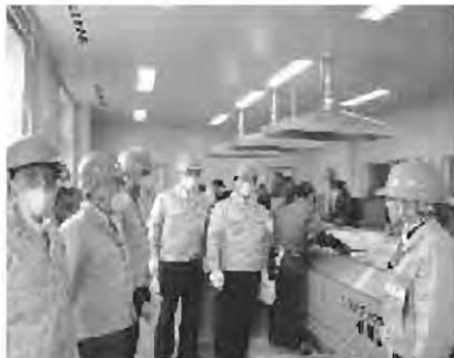
現地調査 (もとみやクリーンセンター)

貸金業法改正の完全実施や相談体制の充実、社会不安の解消や犯罪、自殺者の防止に寄与することから、全委員一致で請願を「採択」と決定しました。