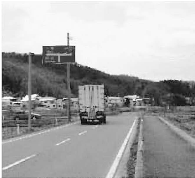
丁字路となっている市道上野台、光田線

答 現時点で、公共施設 ②現在も市の水道料金は ③現在も市の水道料金は ④現在も市の水道料金は ⑤現在も市の水道料金は ⑥現在も市の水道料金は ⑦現在も市の水道料金は ⑧現在も市の水道料金は ⑨現在も市の水道料金は ⑩現在も市の水道料金は