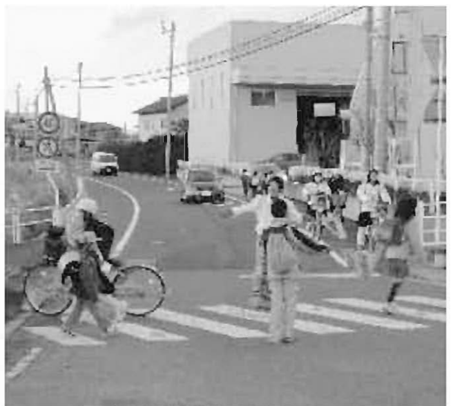
通学時間帯の安全確保を（旧会津街道入口）

②次世代育成計画でも病児保育の大切さをうたっている。今後、様々な角度から検討したい。