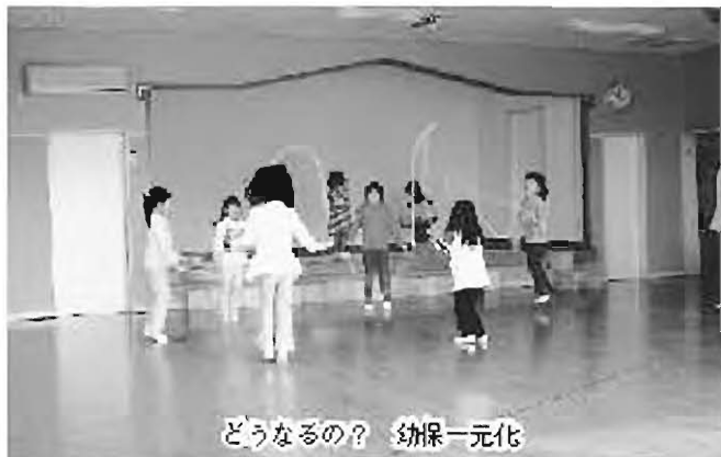
どうなるの？ 幼保一元化

答 4、5歳児を幼保連携で保育する。素案ができしだい庁内、関係機関と協議し対応したい。