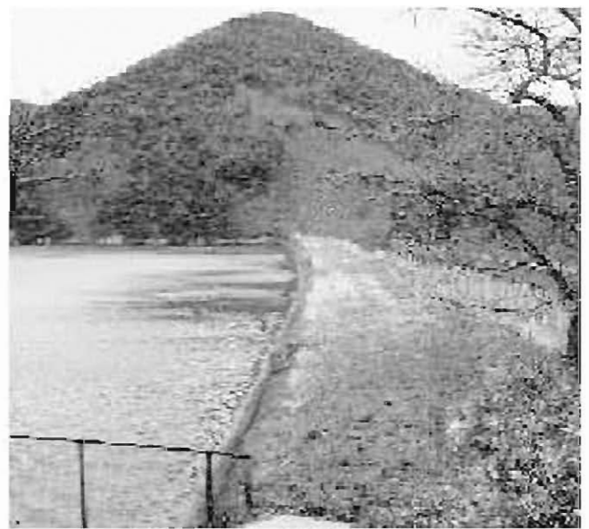
事業停止となった岩根地区のため池

答 ①ストレス簡易調査結果で、問題を抱えているとされた職員へは、主任指導員や心身のケアを行ったと認識しているか。 ②職員の倫理道徳等があった場合、職員懲戒審査委員会を設置して、現時点で制定の必要はないかと考えている。