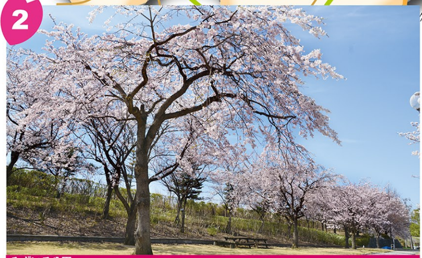
2 みずいろ公園 安達太良川と阿武隈川の合流地点に整備された親水公園で、公園内の歩道はソメイヨシノの桜並木になっており、春の散歩には最適です。また芝の広場にシートを広げてのお花見もできる人気のレジャースポットです。春には境内の前に桜が咲き誇り、情緒あふれる景色を見られます。 所 本宮市本宮馬場27-10 見頃 4月中旬 ¥ 無料 P 有 P 有 ☎ 0243-24-5406(本宮市都市整備課) JR本宮駅から約600m マップコード 129 333 764*85

お願い 桜の保護にご協力願います。特に桜は根元を踏み固めると弱ってしまいます。桜のある場所のほとんどは、個人の所有地です。マナーを守りましょう。