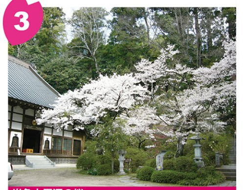
3 岩角山周辺の桜 仁寿元年に慈覚大師によって開かれた霊場で、山中には西国三十三観音などが線刻された巨石が点在します。春には境内の前に桜が咲き誇り、情緒あふれる景色を見られます。 所 本宮市和田東屋口84 見頃 4月中旬 ¥ 無料 P 有 JR本宮駅から約8km マップコード 129 429 024*33

お願い 桜の保護にご協力願います。特に桜は根元を踏み固めると弱ってしまいます。桜のある場所のほとんどは、個人の所有地です。マナーを守りましょう。