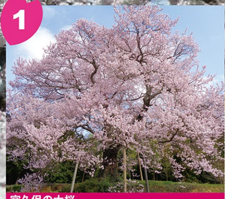
1 宮久保の大桜 地域の人々からは「宮久保(みやくぼ)の肥上げ桜」と呼ばれ親しまれ、また宝暦年間にはすでに大桜であったと伝えられる推定樹齢500年の古い桜です。 所 本宮市長屋鼓石 見頃 4月中旬 ¥ 無料 JR本宮駅から約9km マップコード 129 372 193*42