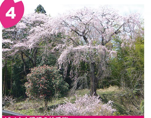
4 城ノ内古戦場の枝垂桜 戊辰戦争の際、敵からの銃撃を受けたが、この桜の木の下に逃げ命が助かった人がいるというエピソードを持つ。樹高約16メートルのヒガンザクラです。 所 本宮市糠沢城内 見頃 4月中旬 ¥ 無料 JR本宮駅から約6km マップコード 129 218 840*25