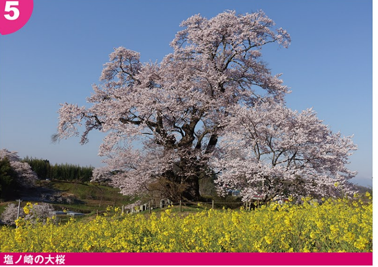
5 塩ノ崎の大桜 周囲を見渡せる小高い丘の上に咲く推定樹齢600年のエドヒガンザクラで、高さは約18メートル、幹囲約7メートルの大桜です。地上1メートルのところまで三枝に分かれ、東西南北各20メートルで均衡がとれた見事な枝ぶり、優雅な佇まいを見せます。平成17年に福島県天然記念物に指定された名木で、地元では「種時き桜」として親しまれてきました。 所 本宮市白岩塩ノ崎278 見頃 4月中旬 ¥ 無料 P 有 ☎ 0243-24-5382(本宮市観光物産協会) JR本宮駅から約8km マップコード 129 251 253*87