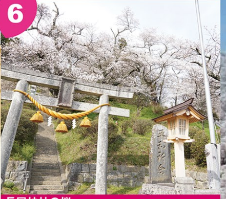
6 長屋神社の桜 山形県羽黒神社の分霊を御神体とする長屋神社は、春には鳥居から続く石段を囲むように咲き誇る桜が参拝者を迎えます。 所 本宮市長屋宮山26 見頃 4月上旬 ¥ 無料 P 有 JR本宮駅から約10km マップコード 129 372 011*76