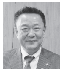
本宮市長 高松 義行