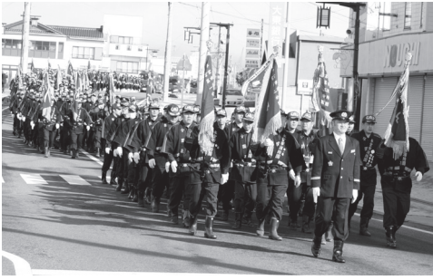
市街地をパレードする消防団の皆さん

式典終了後には、参加者全員・全車両で市内をパレード。ラッパ隊の演奏するなか、隊列を組んで市街地を行進しました。