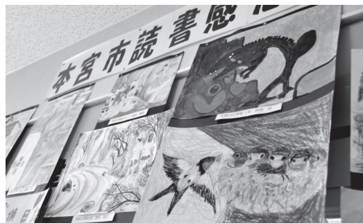
感想文・感想画合わせ636点の応募がありました