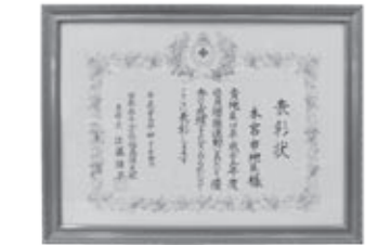
▲4月24日受賞しました

日本赤十字社福島県支部本宮市地区が平成25年度赤十字社員増強運動において120%以上の表彰基準を達成し、福島県支部長から表彰を受賞されました。 皆さんの善意は、日本赤十字社福島県支部を通じて災害救援活動や医療・献血事業などに活用させていただきます。