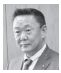
本宮市長 高松 義行