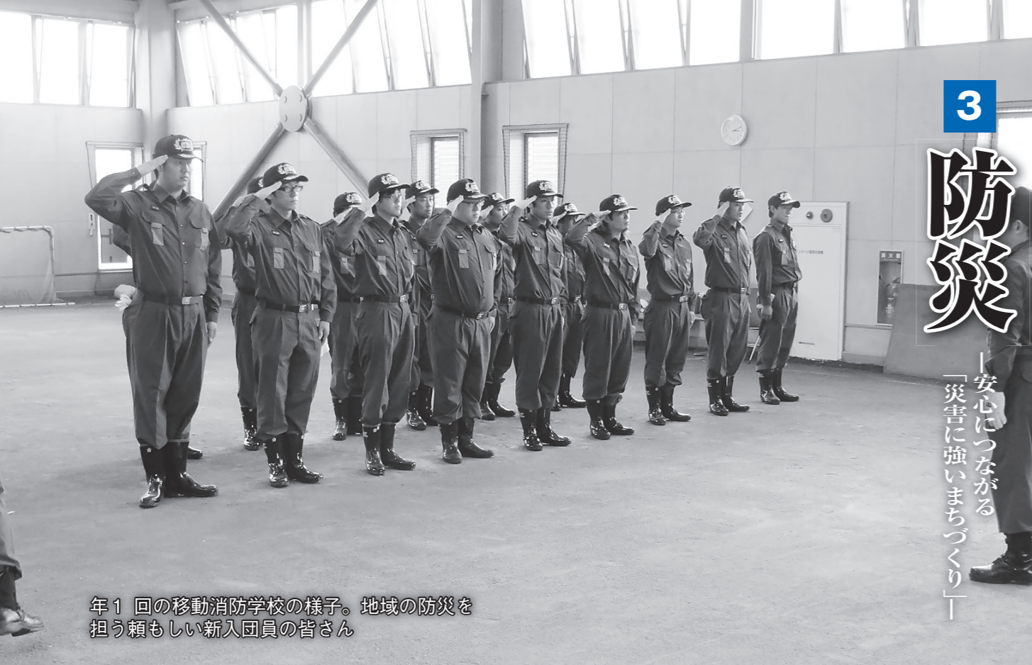
年1回の移動消防学校の様子。地域の防災を 担う頼もしい新入団員の皆さん