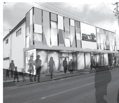
▲4月オープン「ソレイユ本宮」完成予想図