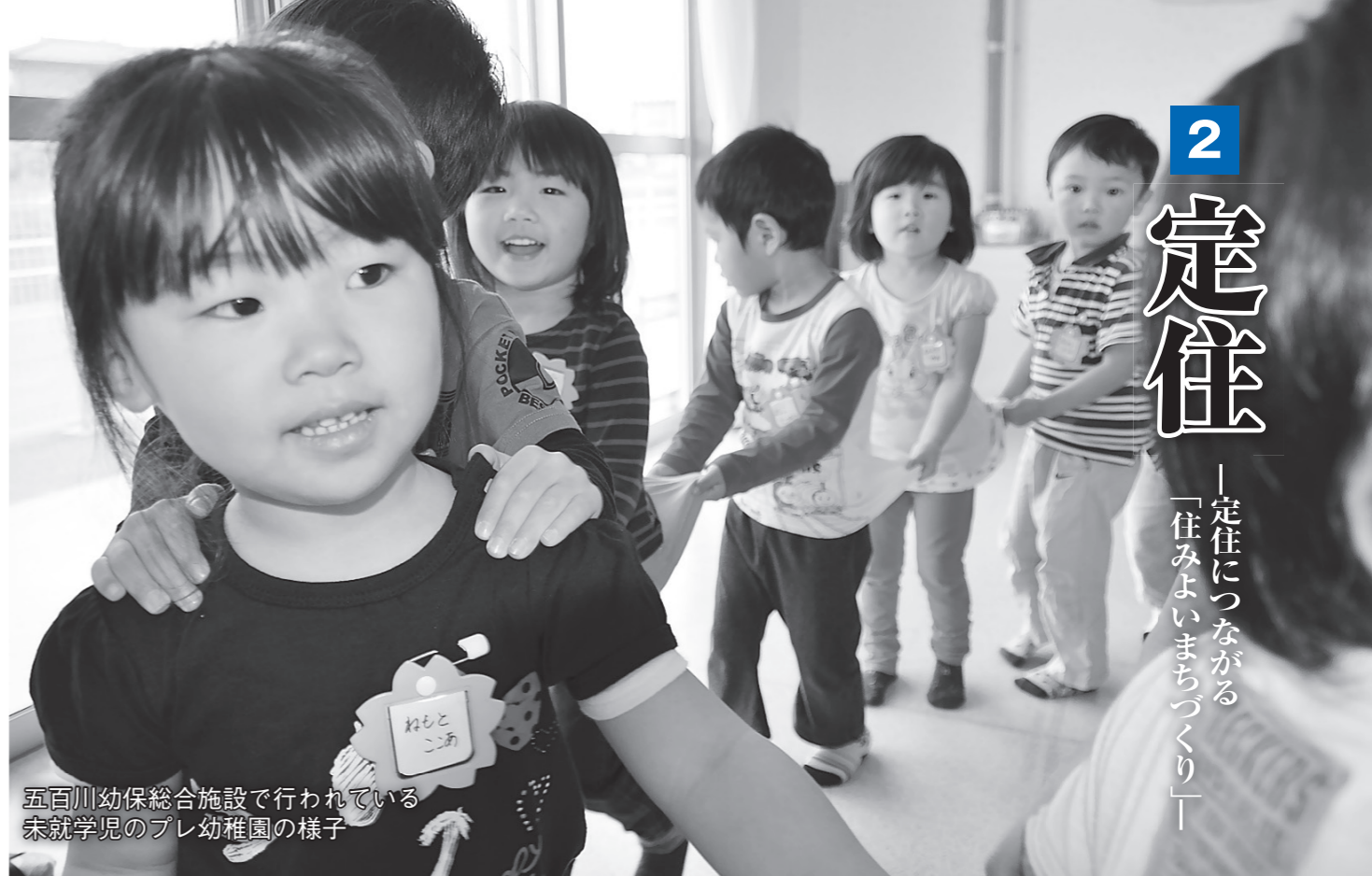
五百川幼保総合施設で行われている 未就学児のプレ幼稚園の様子