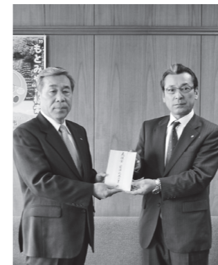
▲晴山執行役員支店長(写真右)

※入居を希望される方は、入居基準の確認および必要書類の提出の必要がありますので、建設課建築係(内線145)へお問い合わせください。なお、一般公募の募集期間は、1月14日(火)から1月24日(金)までとなります。