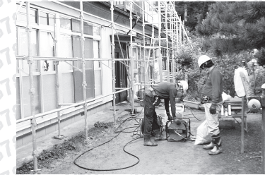
住宅除染作業の様子

平成24年度の一般会計は、当初予算143億8,846万円(内繰越額15億8,346万円)でスタートしましたが、上半期には、65億5,289万円増の補正となりました。下半期には、住宅除染事業、公共施設等除染事業、道路維持補修事業、公共下水道事業特別会計繰出金事業、白沢総合支所周辺道路改良事業等の増、農地等除染事業、本宮第二中学校災害復旧事業、生活保護事業等の補正減を行った結果、7億8,967万円増となり、予算の累計は217億3,102万円当初比51.0%の増となりました。