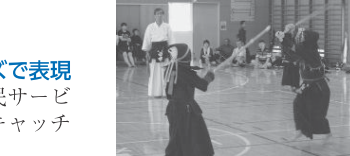
▲昨年8月、上尾市で開催された剣道スポーツ少年団の交流事業

▶上尾市との交流を推進 震災以降、継続的に本宮市を支援していただいている埼玉県上尾市と、市民の交流、文化の交流を深めます。また、両市間の関係構築のため、一友好都市の関係を築きます。