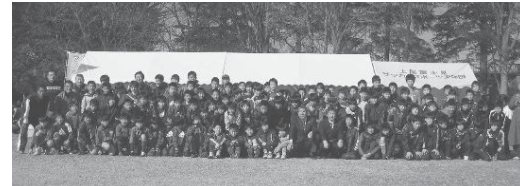
▲1月12日、上尾市で開催されたサッカースポーツ少年団交流事業