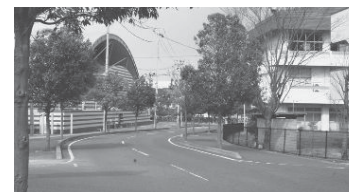
現在の岩根小学校体育館（上）と連絡通路の建設を予定している本宮第一中学校と同体育館（下）

▼まちづくり推進課を新たに設置 まちづくりの企画調整役として、建設部内に「まちづくり推進課」を設置し、本市の基盤となる土地利用の企画と計画の策定を進め、多様化するまちづくりに対応した業務を行います。