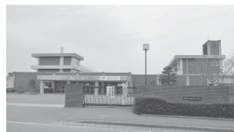
耐震化工事を予定している五百川小学校（上）と白沢中学校（下）

▼教育施設の整備 岩根小学校の体育館建設、本宮第一中学校の体育館連絡通路を建設します。 また、五百川小学校西校舎、白沢中学校校舎の耐震化工事をはじめ、岩根小学校、糠沢小学校のプール補修工事を実施します。