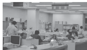
▲建設部に「まちづくり推進課」を設置します

▼まちづくり推進課を新たに設置 まちづくりの企画調整役として、建設部内に「まちづくり推進課」を設置し、本市の基盤となる土地利用の企画と計画の策定を進め、多様化するまちづくりに対応した業務を行います。