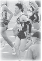
第7中継所 5.4km 第8中継所