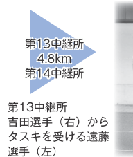
第13中継所 4.8km 第14中継所