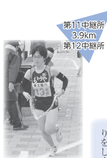
第11中継所 3.9km 第12中継所