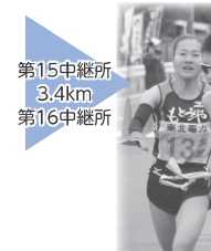
第15中継所 3.4km 第16中継所