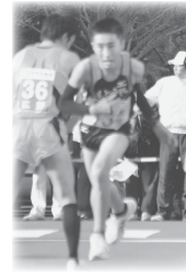
第2中継所 8.2km 第3中継所