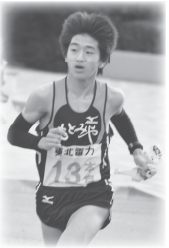
第6中継所 8.3km 第7中継所