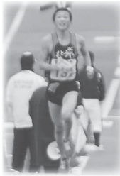
第4中継所 7.3km 第5中継所