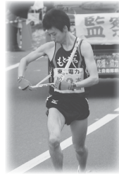
第5中継所 6.8km 第6中継所