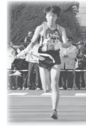
第3中継所 5.8km 第4中継所