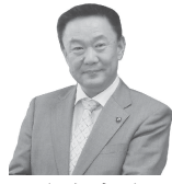
本宮市長 高松 義行