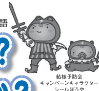
結核予防会 キャンペーンキャラクター シールぼうや