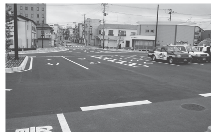
▲本宮駅から駅前商店街方向を望む

■本宮駅前東口広場完成を祝う 7月21日に本宮駅前東口広場が完成しました。 竣工記念セレモニーでは、高松市長をはじめ関係者の皆さんによるテープカットとモニユメントの除幕、また、本宮高等学校吹奏楽部による演奏が披露され、完成を祝いました。 セレモニー後の式典では、樹木の寄贈をいただいた本宮ライオンズクラブ、本宮ロータリークラブをはじめ、時計の寄贈をいただいた施工業者の石橋建設工業(株)の皆さんへ感謝状の贈呈が行われました。