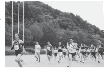
▲第4回もとみや駅伝の様子

【申込・問い合わせ先】 生涯学習センター(中央公民館内) ☎ 33-2611 FAX 33-4488