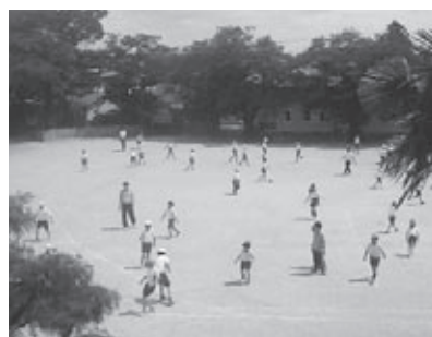
▲校庭で元気に走り回る児童

もうひとつの楽しみは、6人の孫たちの成長でしょうか。孫との会話や笑顔に、いつも元気をもらっています。