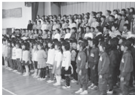
▼昨年度学習発表会での全校合唱の様子

経営の中心にすえ、『一人ひとりの能力や特性に応じ、よさや可能性を『見つけ、伸ばす』創意に満ちた教育』が展開されています。