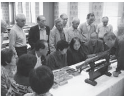
▲鞘について詳しい解説を受ける受講者

現代まで伝わる拵の塗りや形について説明を受けた後、実物の鞘や拵、目貫や鐔などの小道具類を手に取って学びました。受講者は、精緻な細工の小道具を用いて、さまざまな職人の手を経て作り上げられる鞘に見入っていました。