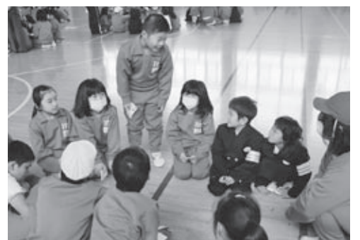
▶縦割り班活動の様子

一つは、縦割り班活動です。赤・青・白・黄色の四色、八班ずつの計三十二班に分かれ、毎日の清掃活動や運動会などの行事を行っています。また、班ごとに遊ぶ時間もあり、上級生から下級生までとても仲が良いのが自慢です。二つは、校舎内外に花があ