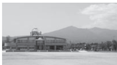
▲本宮まゆみ小学校全景

「豊かな心と強い体で未来を作るまゆみっ子」の育成を、これからも学校、保護者、地域が一体となって進めていきたいと思っています。