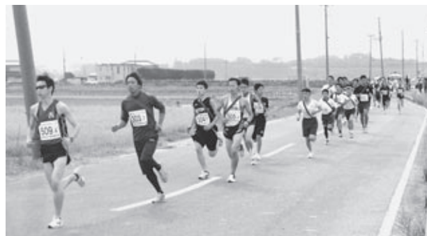
△ 昨年のもとみや駅伝の様子