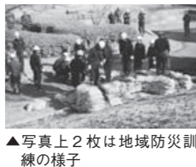
▲写真上2枚は地域防災訓練の様子

災害に備えて 山林火災消火訓練と防災訓練 11月13日に山林火災消火訓練が市消防団、南消防署、警察および県の消防防災ヘリコプターも参加して岩角山（和田字東屋口地内）で行われました。参加団体は有事の際の連携・対応について確認し、災害に備えることとしました。また、11月15日には、本宮市地域防災訓練がみずいる公園で、市消防団および、本宮6区愛宕、荒町、館町の各町内会が参加して行われました。訓練は避難訓練にはじまり、町内会の皆さんによるバケツリレーや消火器による消火訓練、消防団による中継放水、堤防の決壊を防ぐ水防訓練などが行われ、皆さん真剣に取り組んでいただきました。