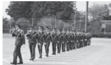
▲ラッパ隊による見事なドリル演奏