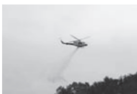
▲山林火災消火訓練の様子