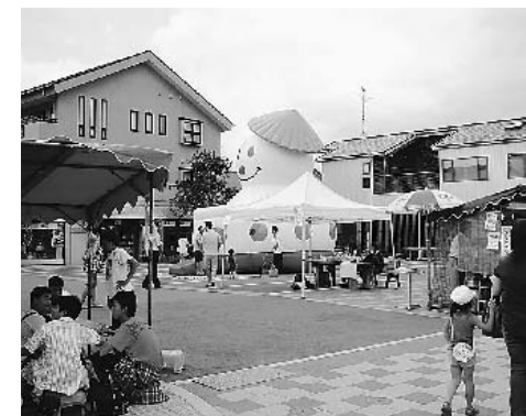
本宮市商店街連合会の出店のようす(昨年の夏まつりから)