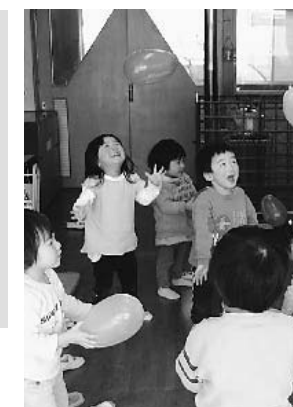
第一保育所の子どもたち