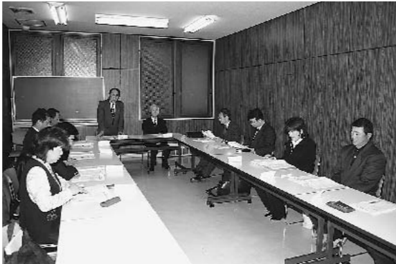
行政改革推進委員会の会議の様子

※「行政経営戦略プラン」、「実施計画書」、「行政改革推進委員会からの答申書」の詳細は、本宮市のホームページをご覧ください。