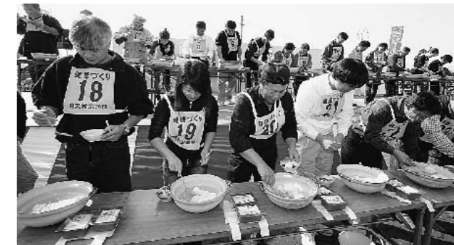
▲昨年のしらさわ秋祭りから「湯じょうふ食べくらべ大会」福島大会

毎年恒例の秋まつりが、本宮会場と白沢会場で開催されます。秋の実りに感謝しながら、それぞれの会場で行われる「本宮市秋まつり」に、皆さんぜひ、お越しください。