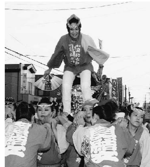
▲昨年の本宮秋まつりから熱気あふれる「真結女みこし」